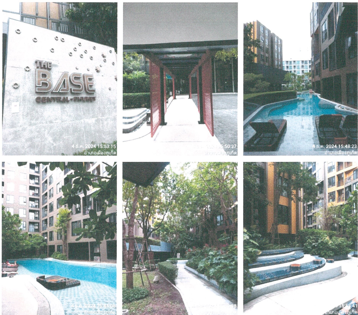
รูปภาพที่ 1.3 การใช้พื้นที่ของโครงการ